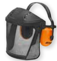
GELAATS- EN GEHOORBESCHERMER FUNCTION GPA 24 € 33 20