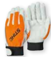
HANDSCHOENEN DYNAMIC SENSOLIGHT € 19 30

Om zware gewichten te tillen, zijn slipvaste veiligheidshandschoenen met snijbescherming onontbeerlijk. De STIHL werkhandschoenen beantwoorden aan de meest uiteenlopende eisen. Naargelang het type beschermen ze tegen onder andere snijwonden, wind, water, koude en doornen. De STIHL kettingzaaglaarzen bieden de nodige bescherming bij het hanteren van een kettingzaag.