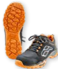
VEILIGHEIDSSCHOENEN WORKER S2 € 111