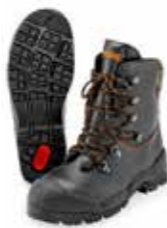
LEDEREN LAARZEN FUNCTION € 184