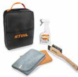
CARE & CLEAN KITS REINIGINGS- EN ONDERHOUDSKIT