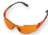
VEILIGHEIDSBRIL FUNCTION LIGHT ORANJE € 10 10

Gezichts- en gehoorbeschermers zijn cruciaal om uw ogen en oren te beschermen tegen motorgeluiden, spaanders en splinters. Bij STIHL vind je een groot assortiment voor de meest uiteenlopende toepassingen. Van veiligheidsbrillen met uv-bescherming tot een individueel instelbare helmset.