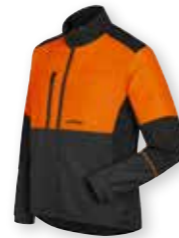
JACK FUNCTION € 68

Bij tuin- en bosbouwwerkzaamheden draag je het best veiligheidskleding die voldoende snijbescherming biedt. De veiligheidsuitrusting van STIHL zit erg comfortabel en garandeert bewegingsvrijheid dankzij de elastische materialen, die tegelijk beschermen tegen water, wind en koude. Individueel regelbare ventilatieopeningen zorgen voor een optimale lichaamstemperatuur.