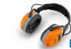
GEHOORBESCHERMER DYNAMIC GB 29 € 127*