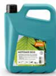
MOTOMIX ECO BRANDSTOFMENGSEL

onderhouden. Gebruik hiervoor onze Care & Clean kits; een basisassortiment met onderhoudsproducten voor kantenmaaiers en bosmaaiers, heggenscharen, grasmaaiers en robotmaaiers. Zo blijft uw machine steeds schoon én goed onderhouden.